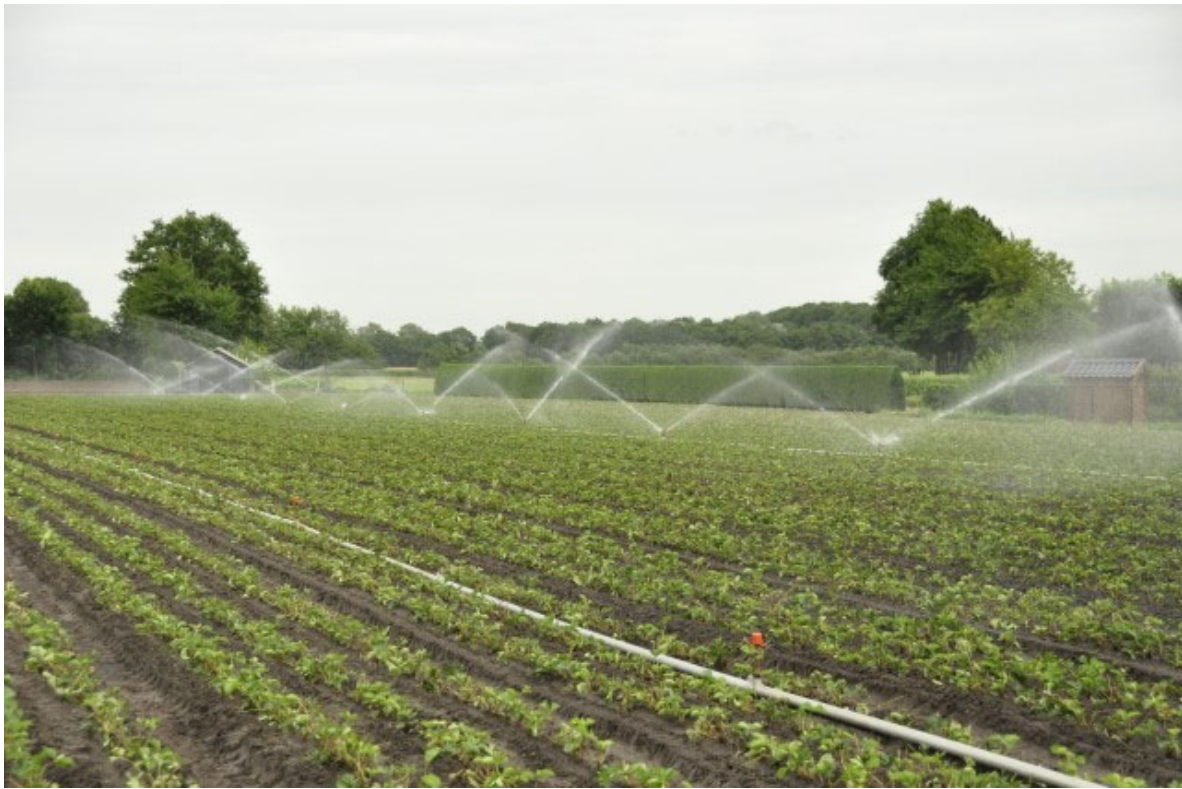
Afbeelding 3: Buizen-beregeningsinstallatie in aardbeien