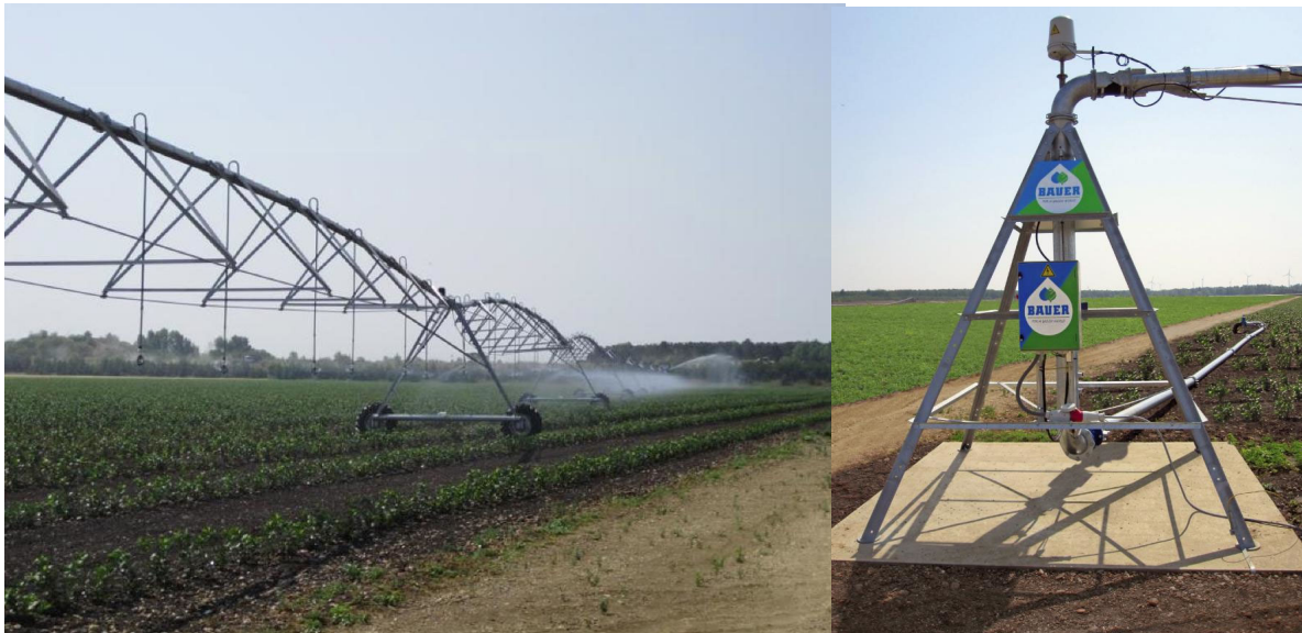
Afbeelding 6 en 7: Pivot-systeem, de irrigatieboom en het centrale punt (pivot)

Het aantal pivotsystemen is zeer beperkt, mogelijk slechts een tiental in Nederland. In de Veenkoloniën zijn dit er een zevental (Boerderij, 2014). Een pivot-installatie werkt met een centrale waterbron, hiermee is deze makkelijk elektrisch aan te drijven. De beregeningsinstallatie draait om een vast punt of volgt een vast spoor. Bij het draaien om een centraal punt zijn er bij rechte verkaveling veelal hoeken op het perceel welke niet worden beregend. Het pivot-systeem is niet verplaatsbaar en hierdoor sterk bedrijf en kavel gebonden. Voor huur van percelen bij andere boeren is de beregening niet geschikt. Daarnaast liggen de kosten dicht in de buurt van of lager als een beregeningshaspel (Factsheet praktijknetwerk beregening). Het beregenen zelf kent voordelen in de arbeidsbehoefte tijdens het beregenen.