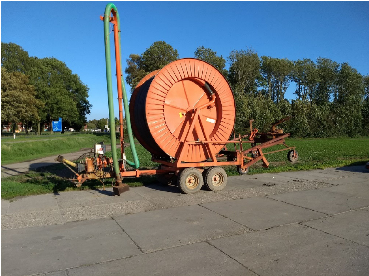
Afbeelding 2: AP Faber beregeningshaspel met aftakspomp