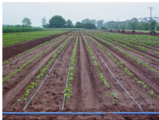
Afbeelding 4 en 5: Druppelirrigatie in aardappelen en groenten