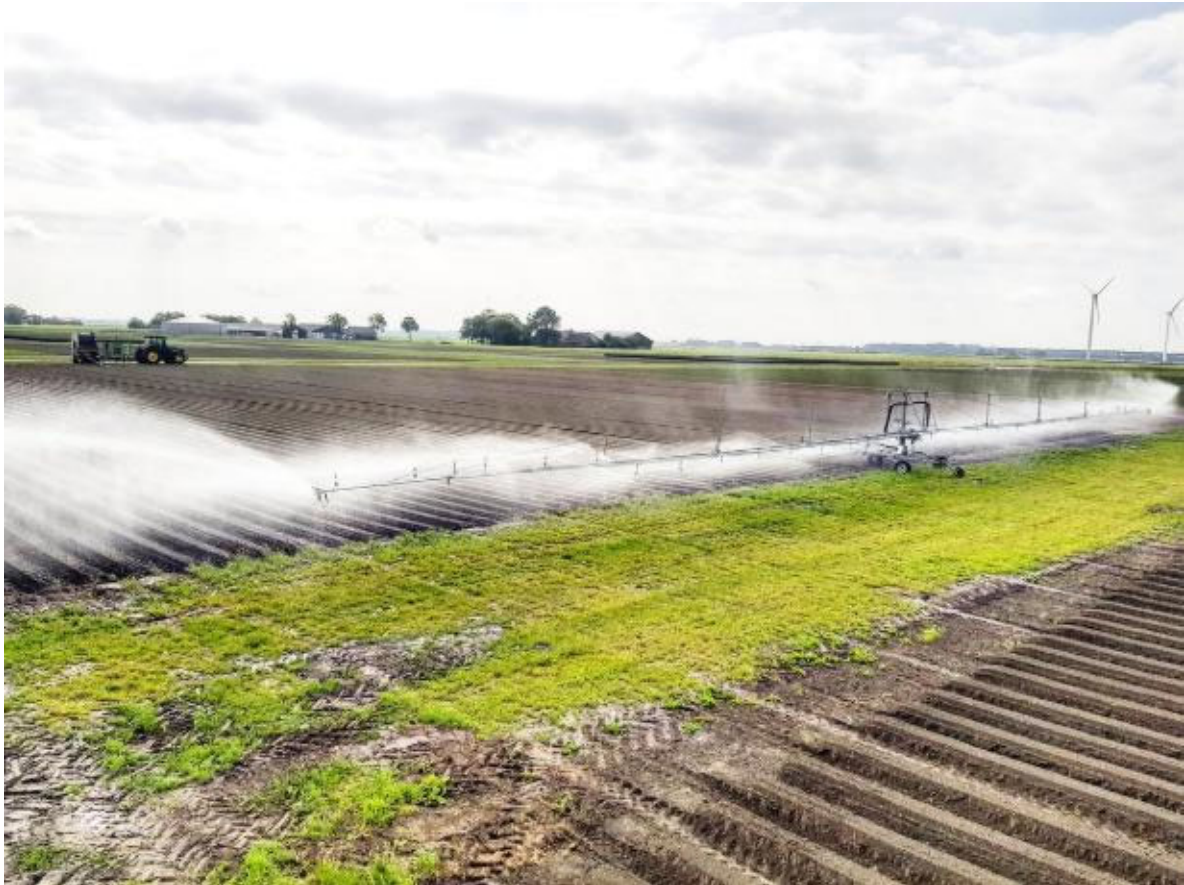
Afbeelding 1: Sproeiboom

Een andere beginnende trend is elektrische aandrijving. Dit is sterk afhankelijk van de situatie. De keuze is vooral ingegeven door de brandstofkosten. De energiekosten van een elektrische pomp zijn lager per uur dan een vergelijkbare dieselpomp (Boerderij, 2019).