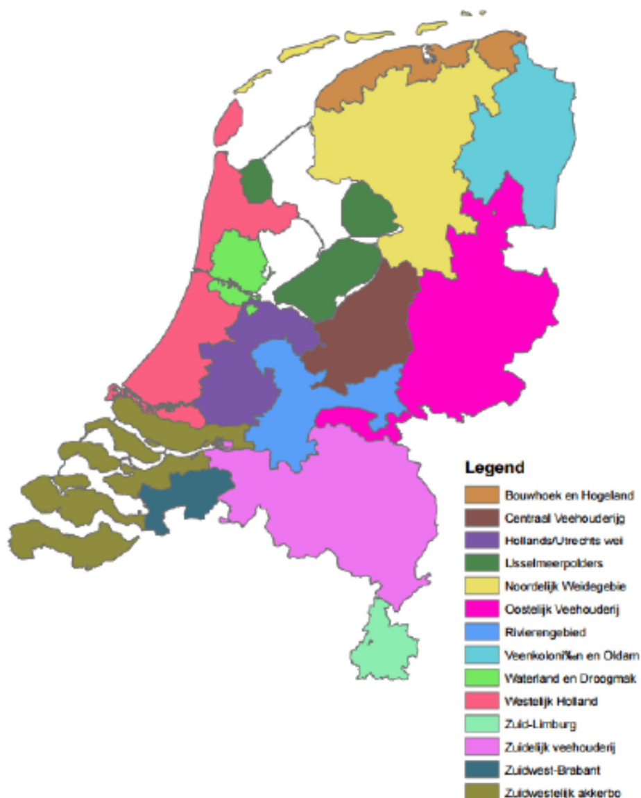
Figuur 2: Landbouwregio's in Nederland

In deze studie zijn twee landbouwregio's opgenomen: Veenkoloniën/Oldambt en Zuidelijk Veehouderijgebied. Elke landbouw regio kent zijn eigen specifieke kenmerken. De beide regio's zijn opgenomen in het onderstaande figuur.